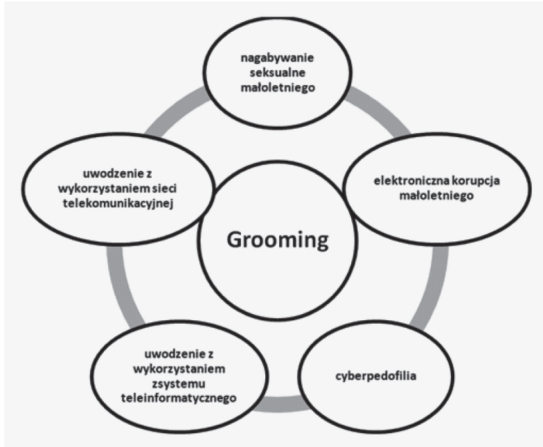
Rysunek 1. Określenie groomingu w języku polskim

spotkać się w świecie wirtualnym. Niewielu jednak wie, że związane jest ono ściśle z aktami przemocy seksualnej stosowanej przez sprawców na dzieciach 20 .