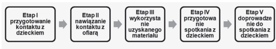
Rysunek 3. Etapy groomingu

Źródło: opracowanie własne na podstawie E. Machowska, Cyber grooming jako ryzykowne relacje internetowe podejmowane przez dzieci i młodzież , „Articles” 2 (2016), s. 118-119.